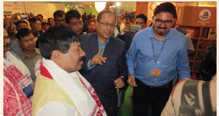
Shri Attul Bora, Minister of Agriculture, Horticulture and Food Processing, Animal Husbandry and Veterinary and Town & Country Planning, Govt. of Assam visiting Spices Board stall in the 4th Assam Int'l Agri Horti Show, 6-9 January, 2017 at Guwahati.