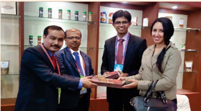
Officials of the Indian Embassy, Lima, Peru along with the Board's officials at Board's stall in Expoalimentaria, Peru from 28 to 30 September 2016