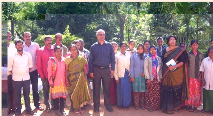
Chairman and Director (Res) with Farm labourers of ICRI, RRS, Sakleshpur