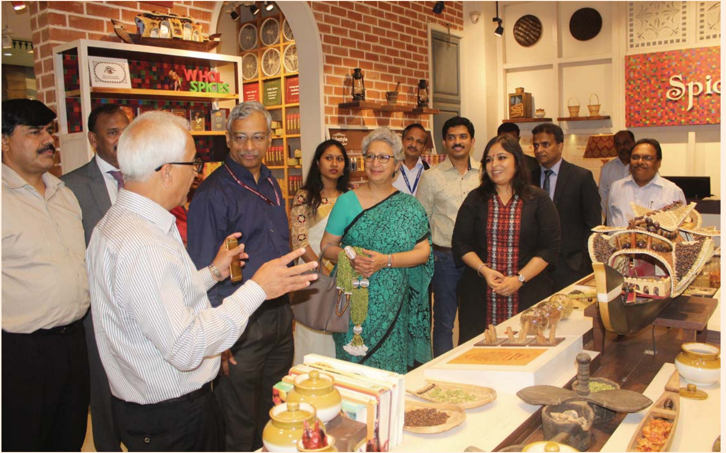
Smt. Rita Teatota IAS, Commerce Secretary, Ministry of Commerce & Industry, Govt. of India interacting with Spices Board officials at Spices India Signature Stall Lulu Mall, Kochi on 16th March 2017.