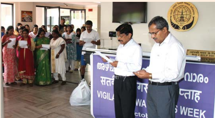
Pledge on National Unity Day observed on 31 October, 2016 at MPEDA Office jointly with Spices Board officials.