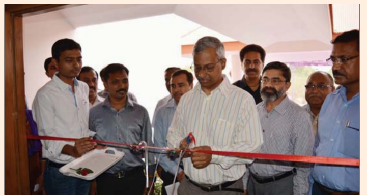
Inauguration of Quality Evaluation Lab at Kandla, Gujarat on 4th March 2016