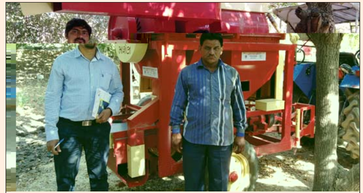
A farmer with seed spice thresher, under MIDH Scheme, Unjha, Gujarat.