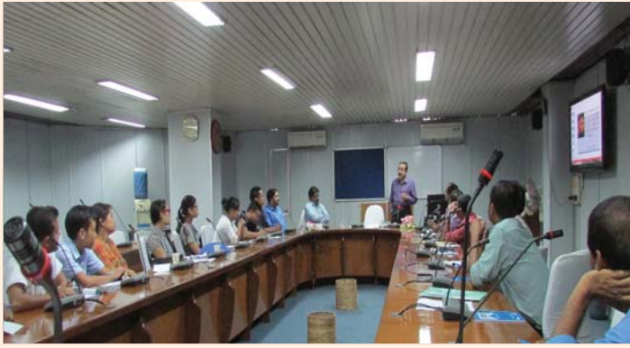
Regional Hindi Workshop for staff – Guwahati (Assam)