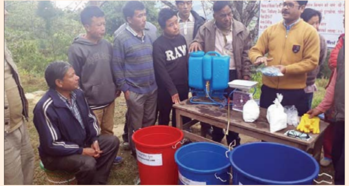
Demonstration plot- Doorkhola, Kalimpong -A group of farmers with AD, Kalimpong giving demo for making Bordeaux mixture on 23 December, 2016