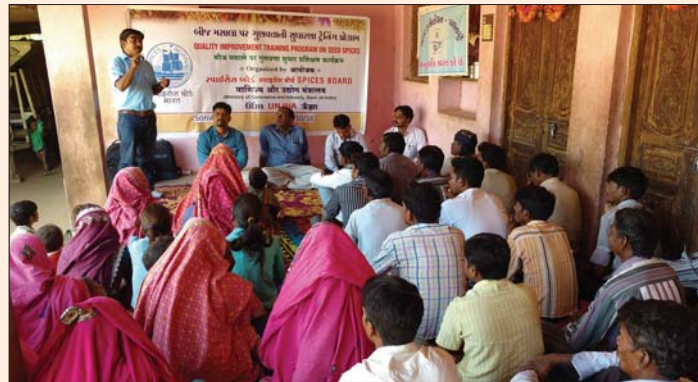
QITP on seed Spices, Sonwadi, Unjha, Gujarat.