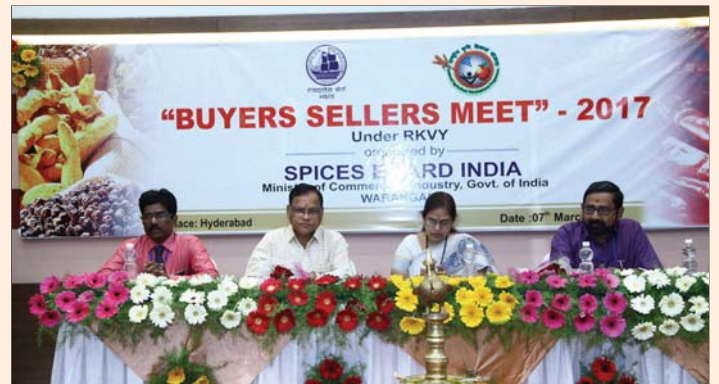
Buyers Sellers Meet, under RKVY in Hyderabad on 07 March, 2017