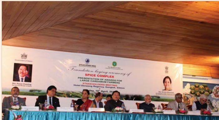
Dignitaries on the dais during the foundation stone laying ceremony of Spice Complex at Sikkim