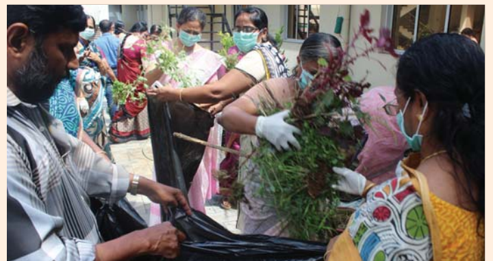
Cleaning of office premises in connection with Swachh Bharath Mission