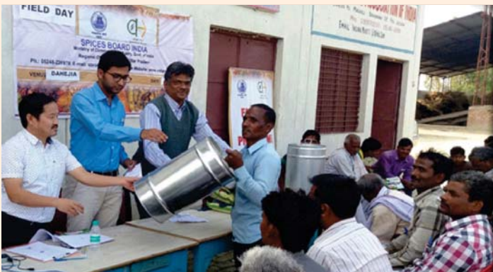
Distribution of GI drum for storing mint oil as critical inputs to farmers in field day on 15 March, 2017