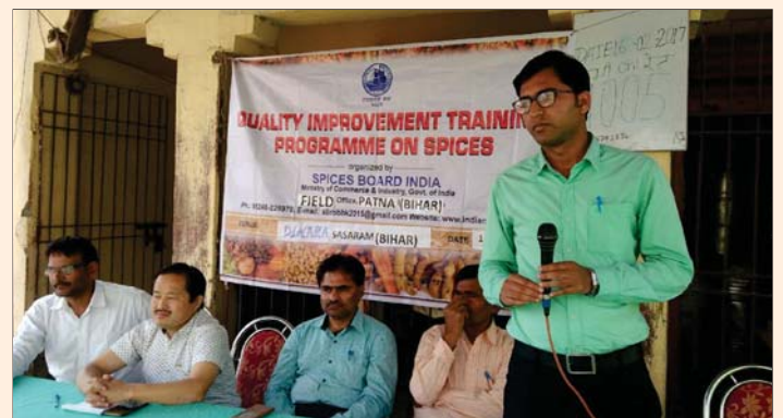
Quality improvement training programme at Dinarta, Bihar on 16th February, 2017