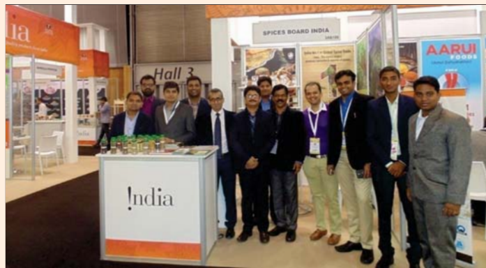
Spices Board's Officials with Spices Exporter participants at SIAL FOOD, PARIS 16 to 20 October, 2016