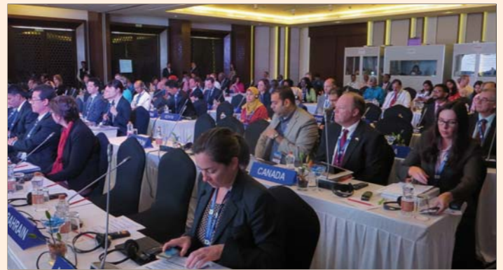
Participants from other countries attending the third session of CCSCH