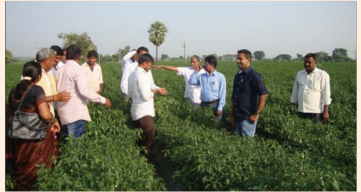
Demonstration of technologies under MIDH for chilli, Warangal, Telangana.