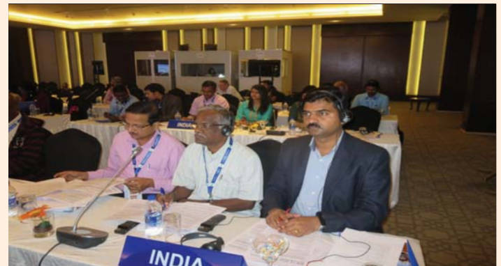
Delegates from India attending the CCSCH3