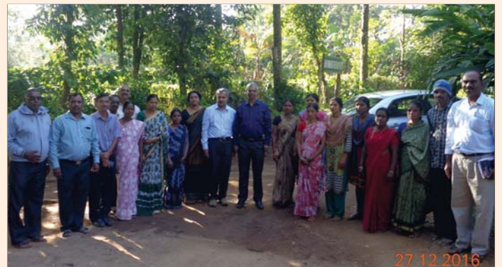
Chairman, Secretary & Director (R&D) with officers & nursery labourers of Deptl. Nursery, Bettadamane, Karnataka on 28 December, 2016.