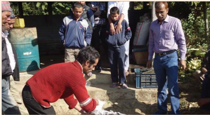
Demonstration on mass multiplication of Trichoderma with cow dung on 27 December 2016 in East Sikkim.