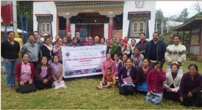
QITP on Organic farming to women farmers on 30 November, 2016 in North Sikkim.