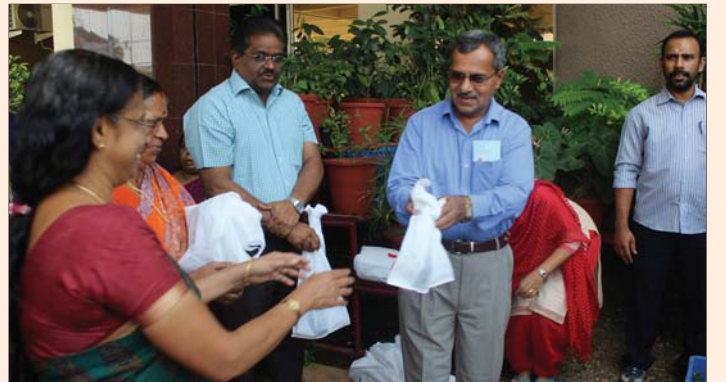
Distribution of curry leaf plants to staff members in connection with Conservation Day on 25, November, 2016 (Quami Ekta Week 19-25 November, 2016)