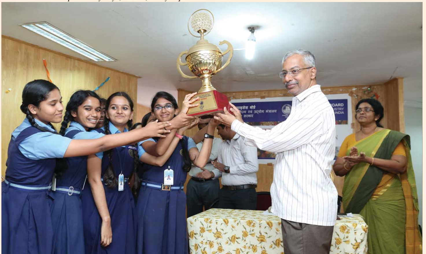
Hindi Patriotic Song [Group] competition for Higher Secondary School - First Prize [Bhavan's Newsprint Vidyalaya, Velloor, Kottayam ]