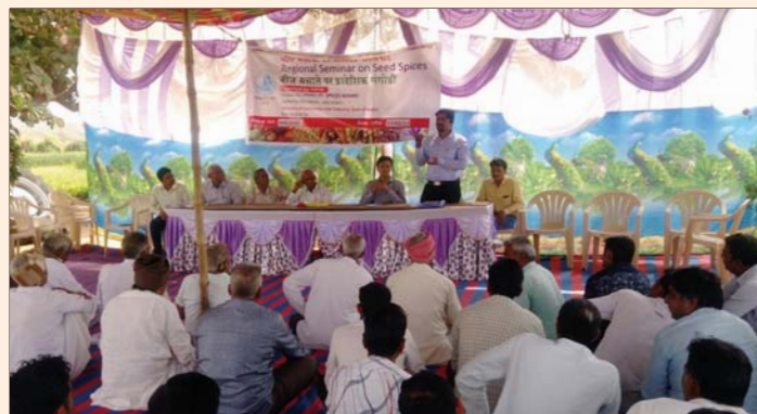
Regional seminar on seed spices in Malivas on 17 February, 2017