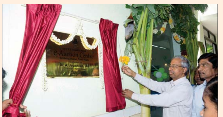
Inauguration of E-auction Centre at Bodinayakanoor on 30th May 2016