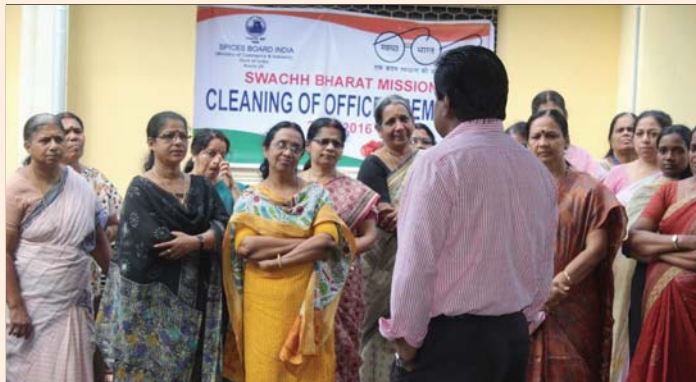
Inauguration of Swachh Bharath Mission in Spices Board on 23 September, 2016