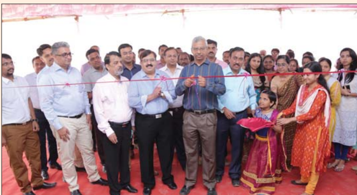
Inauguration of Quality Evaluation Lab at Mumbai on 13th May 2016