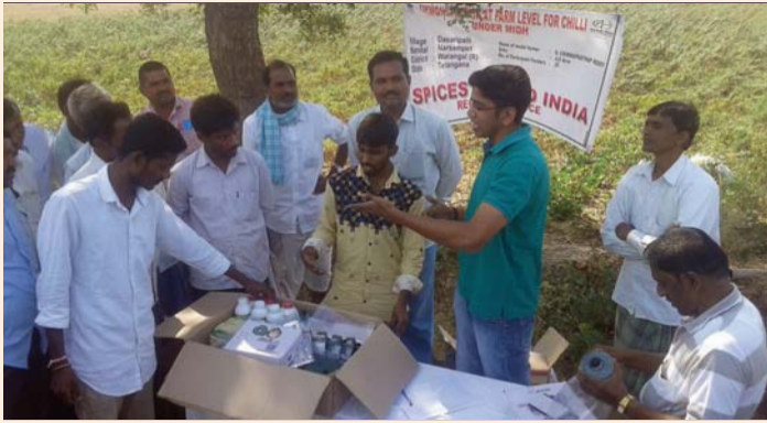
Demonstration plot at farm level for chilli under MIDH Scheme in Dararapilli village, Warangal, Telangana.