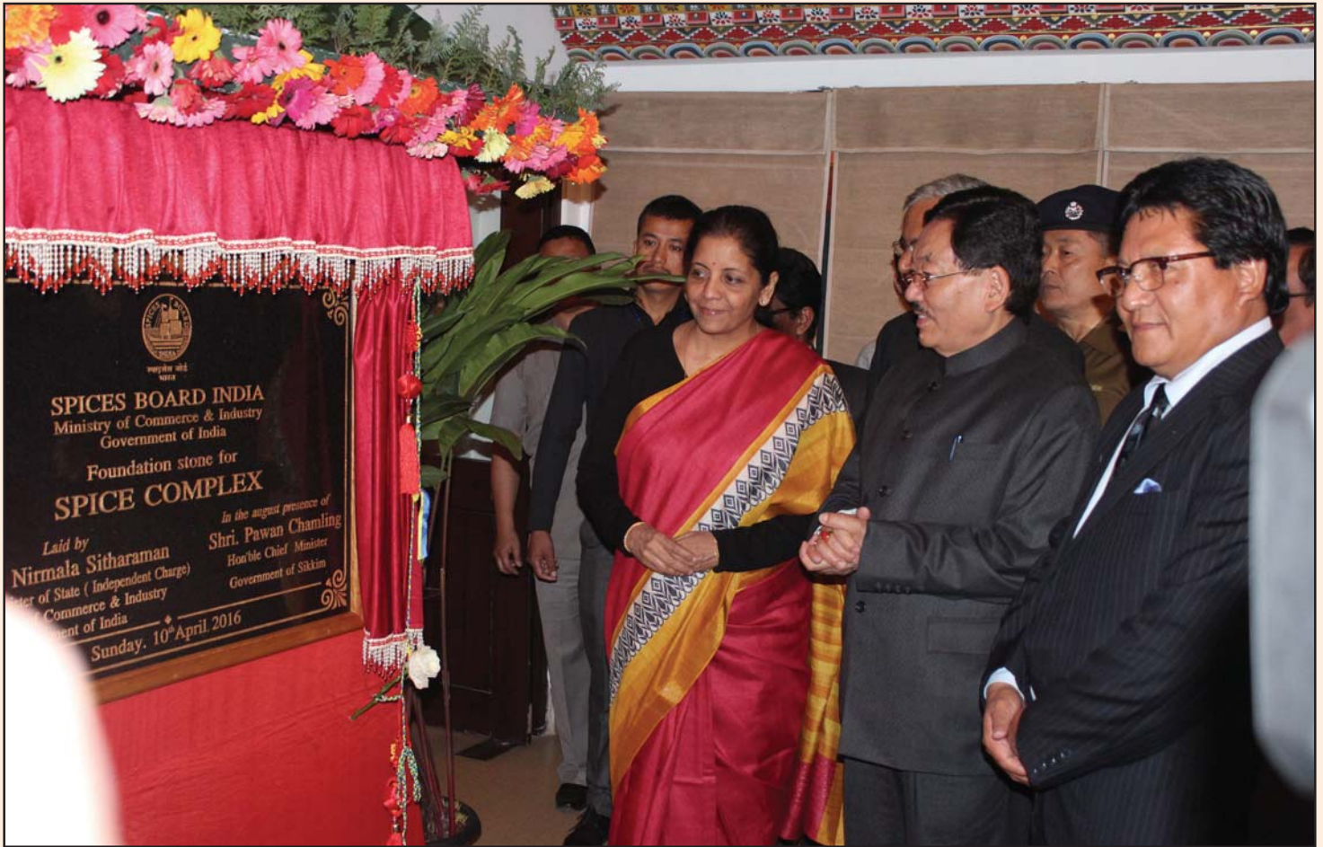
Foundation stone laying of Spice Complex at Sikkim on 10.4.2016 by Smt Nirmala Sitharaman, Hon'ble Minister of States for Commerce & Industry, Govt. of India in the presence of Shri. Pawan Chamling, Hon'ble Chief Minister of Sikkim