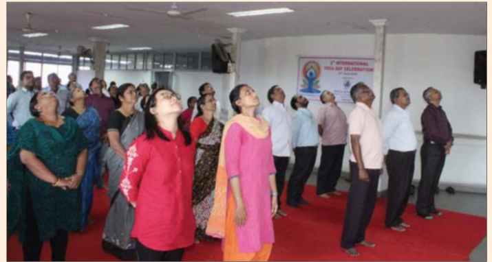
Celebration of International Yoga day in Spices Board 21 June, 2016