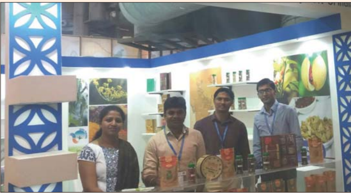
Spices Board officials at Board's stall in Aahar, New Delhi held from 7 to 11 March 2017