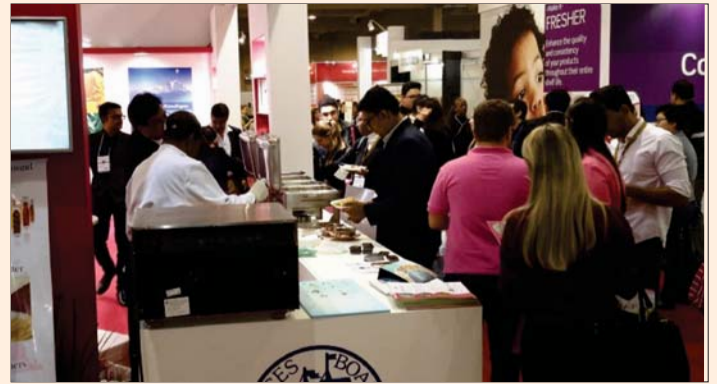
Cookery Show at Spices Board's stall at SIAL FOOD, PARIS 16 to 20 October, 2016