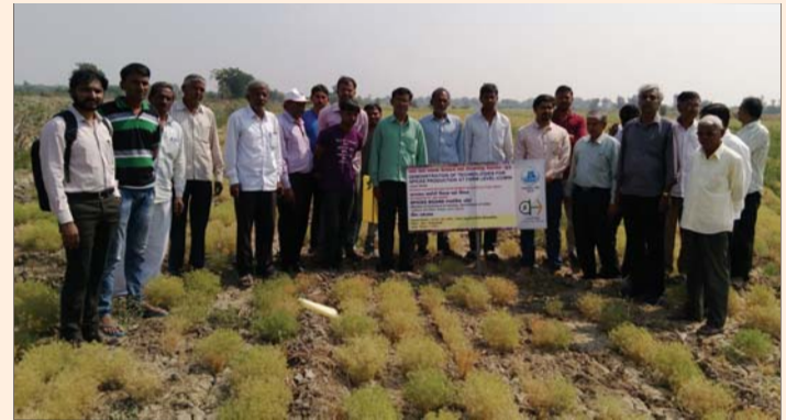
Demonstration of technologies for spices production at farm level – Cumin plot in Vinzuwada, Gujarat.