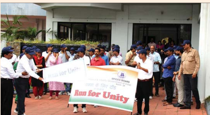
National Unity Day observed on 31.10.2016 by mass run jointly with staff member of MPEDA and Spices Board to commemorate birth anniversary of Sardar Vallabhai Patel.