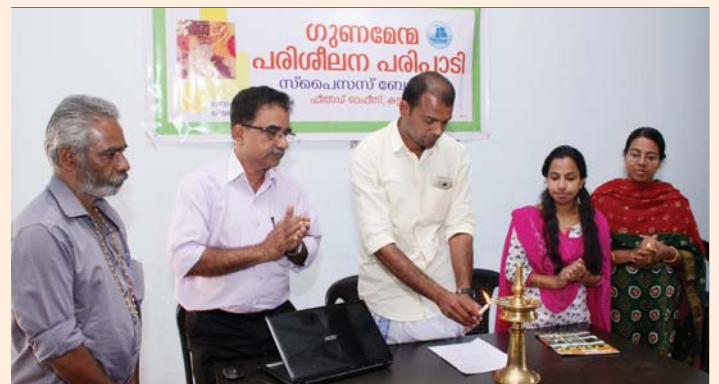
Quality Improvement Training Programme conducted by the Kattapana Field Office atThoprakudy