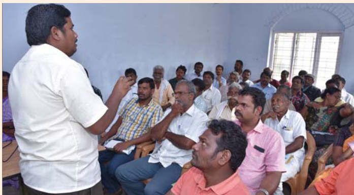
Quality Improvement Training Programme conducted by the Santhanpara Field Office at Chinnakkanal on 10 November, 2016