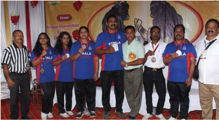
Arm Wrestling competition held at Raipur, Chhattisgarh during 20 - 24 May, 2016