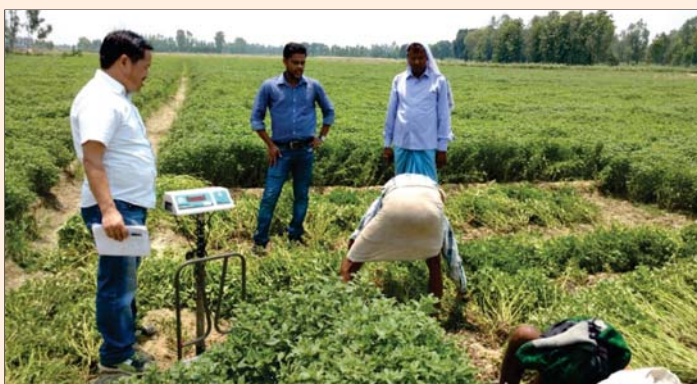
Implemented project on "Mapping, inventory and assesment of menthol mint crop ( Mentha arvensis L. ) using satellite remote sensing and geospatial technologies" in collaboration with ISRO.