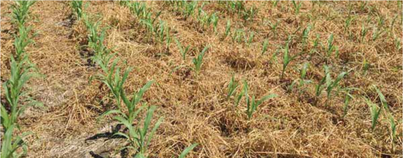
ജൈവാവശിഷ്ടങ്ങൾ മണ്ണിനുമുകളിൽ വിതറി കാറ്റ്, വെള്ളം എന്നിവമൂലമുള്ള മണ്ണൊലിപ്പിനെ പ്രതിരോധിക്കുന്നു.