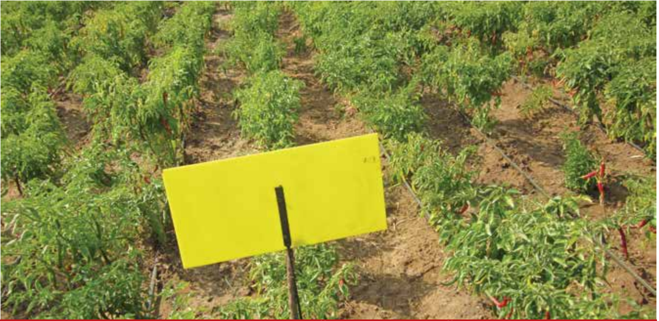
കീടനിയന്ത്രണത്തിന് യെല്ലോ സ്റ്റിക്കി ട്രാപ്