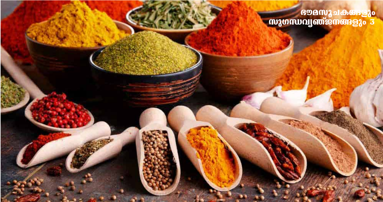
ഭാരതസുചകങ്ങളും സുഗന്ധവ്യഞ്ജനങ്ങളും 3