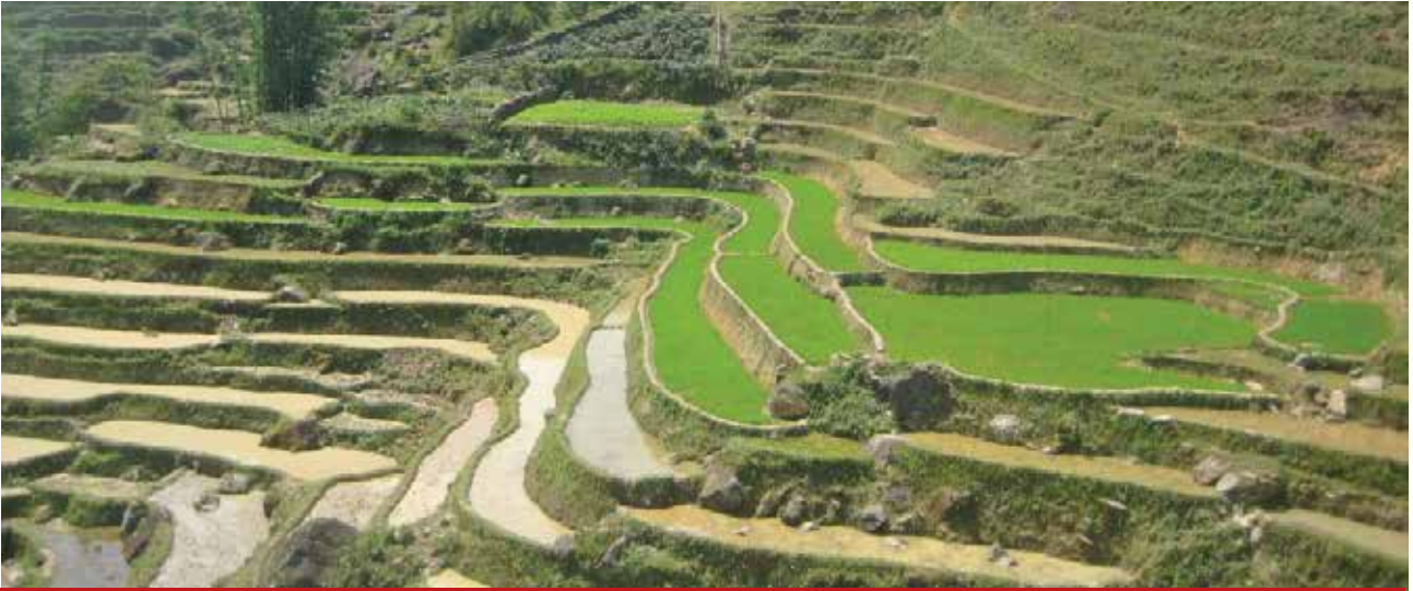
മണ്ണിനും ജലസംരക്ഷണത്തിനുമായി കോണ്ടൂർ കൃഷി

എല്ലാ കാർഷികരീതികളും കോണ്ടൂർ ലൈനിന് അനുസരിച്ചുവേണം ചെയ്യാൻ. ചെരിവിന് കുറുകെ നിർമ്മിക്കുന്ന തടങ്ങളും വാരങ്ങളും ഒഴുകുന്ന വെള്ളത്തിന് തുടർച്ചയായി ചെറിയ തടസങ്ങൾ സൃഷ്ടിക്കും. അങ്ങനെ വെള്ളത്തിന്റെ ഒഴുക്കിന്റെ വേഗത കുറയ്ക്കുകയും മണ്ണൊലിപ്പ് തടയുകയും പോഷകനഷ്ടം കുറയ്ക്കുകയും ചെയ്യും. കുറഞ്ഞ മഴ ലഭിക്കുന്ന മേഖലകളിൽ അധികനിരക്കിൽ മണ്ണിലേക്ക് ജലം ആഴ്ന്നിറങ്ങുന്നതിനും വെള്ളത്തിന്റെ ഒഴുക്കിന് തടസങ്ങൾ സൃഷ്ടിച്ച് മണ്ണിലേക്ക് ആഴ്ന്നിറങ്ങുന്നതിനുള്ള സമയം കൂട്ടുന്നതിനും അതുവഴിമണ്ണിന്റെ ഈർപ്പം നിലനിർത്തുന്നതിനും മണ്ണിന്റെ ഫലപുഷ്ടി സംരക്ഷിക്കുന്നതിനും ഇത് സഹായിക്കും. ഈ രീതി മണ്ണിന്റെ നഷ്ടം കുറയ്ക്കുകയും മണ്ണിന്റെ ഫലപുഷ്ടിയും ഈർപ്പവും കാത്തു സൂക്ഷിക്കുകയും അതുവഴി വിളകളുടെ ഉത്പാദനക്ഷമ വർദ്ധിപ്പിക്കുകയും ചെയ്യും. എന്നാൽ, ഈ രീതിയുടെ ഫലക്ഷമത, മഴയുടെ കാഠിന്യത്തേയും മണ്ണിന്റെ ഇനങ്ങളേയും ഒരു പ്രദേശത്തിന്റെ ഘടനയേയും (Topography) ആശ്രയിച്ചിരിക്കും. കോണ്ടൂർ കൃഷിരീതിയിൽ മണ്ണിന്റെ ചെരിവിനും കൈകാര്യരീതികൾക്കും ഉപയോഗിക്കുന്ന കാർഷികോപകരണങ്ങൾക്കും അനുസരിച്ചായിരിക്കണം കോണ്ടൂർ നിരകളുടെ വീതി നിശ്ചയിക്കേണ്ടത്.