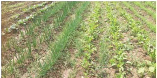
മണ്ണ് സംരക്ഷണ നടപടിയായി ഇടവിളകൾ

ജൈവ, അജൈവ വസ്തുക്കൾ മണ്ണിന് മുകളിൽ നിരത്തിയിട്ട് സംരംക്ഷണം നൽകുന്നതിനെയാണ് പുതയിടൽ എന്നു പറയുന്നത്. ഇത് മണ്ണൊലിപ്പ് തടയുന്നതിനും വലിയ മഴയുടെ ആഘാതം കുറ