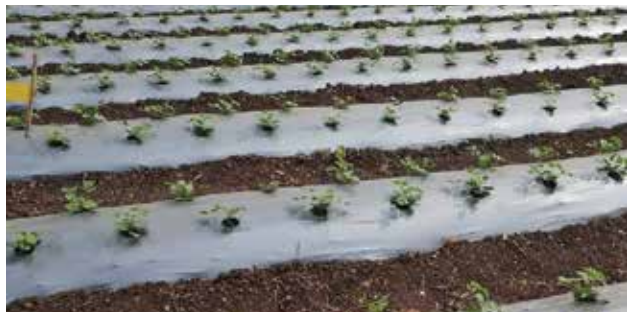
കള നിയന്ത്രണ ഗ്രൗണ്ട് കവർ

മണ്ണിന്റെ ഉപരിതലത്തിൽ ഒരു പുത നൽകുന്നതു പോലെയുള്ള സംരക്ഷിതമായ ഉഴവ് നടത്തുന്നത് പതിവാണ്. സാധാരണരീതിയിലുള്ള ഉഴവിൽ എല്ലാത്തരം വിളകളുടെ അംശങ്ങളും മണ്ണിലേയ്ക്കു ചേർക്കുകയാണെങ്കിൽ ഈ രീതിയിൽ മണ്ണിനു മുകളിലായി ജൈവാംശങ്ങൾ നിലനിർത്തുകയാണ് ചെയ്യുന്നത്. ഇത് കാറ്റും വെള്ളവും മൂലമുള്ള മണ്ണൊലിപ്പിൽനിന്ന് സംരക്ഷണം നൽകും. ഈ രീതിയിൽ വിളകൾ കൃഷി ചെയ്യുന്നതിനുമുമ്പും ശേഷവും മണ്ണിന്റെ ഉപരിതലത്തിൽ 30 ശതമാന മെങ്കിലും വിളകളുടെ അവശിഷ്ടങ്ങൾകൊണ്ട് മൂടിയിരിക്കണം. അടുത്ത വിളയിറക്കുന്നതുവരെ മണ്ണൊലിപ്പ് തടയുന്നതിനും അന്തരീക്ഷത്തിൽ കാർബൺ ഡൈ ഓക്സൈഡിന്റെ അളവ് കുറയ്ക്കുന്നതിനും (Carbon Sequestration) ഇത് സഹായിക്കും. കുറഞ്ഞ രീതിയിൽ ഉഴുക, കുറച്ചു മാത്രം ഉഴുക, ഉഴാതിരിക്കുക, നേരിട്ട് ഉഴുക, പുത നൽകി ഉഴുക, അവശിഷ്ടങ്ങൾ പുതയായി നൽകുന്നതിനായി ഉഴുക, അവശിഷ്ടങ്ങൾ മണ്ണിന്റെ ഉപരിതലത്തിൽ വിതറിയുള്ള കൃഷി, സ്ക്രിപ്പ് ഉഴവ് എന്നിങ്ങനെ വ്യത്യസ്ത രീതികളുണ്ട്. വലിയ തോതിൽ കാർഷികോപകരണങ്ങൾ ഉപയോഗിച്ച് നിലമൊരുക്കുന്ന സംവിധാനത്തിൽ മഴ മൂലമുള്ള മണ്ണൊലിപ്പ് തടയുന്നതിനും ജൈവാംശം നിലനിർത്തുന്നതിനും ഈ രീതി ഉപയോഗിക്കാറുണ്ട്.