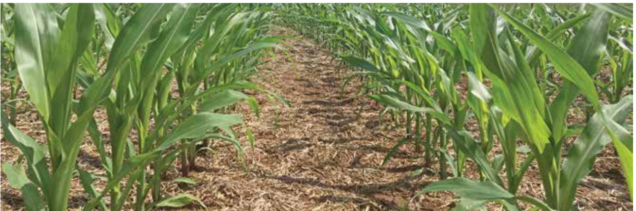
പുതയിട്ട് കൊടുക്കുന്നതുവഴി ഇൗർപ്പം സംരക്ഷിക്കുകയും കളകളുടെ വളർച്ച തടയുകയും ചെയ്യാം